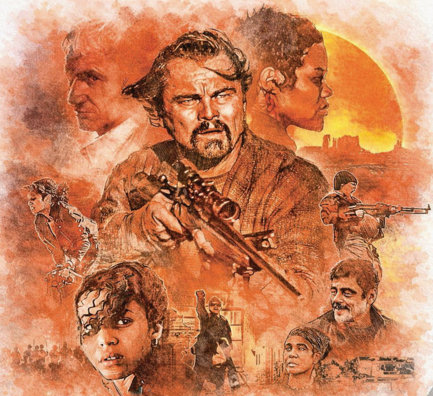
From Writer/Director NIRMALA SITHARAMAN

ced focus on improving logistics through freight corridors, would aid the sector. “This gives exporters more time to ship orders, reduces working-capital stress, and lowers the risk of penalties,” said an official. The scope of duty-free inputs in footwear manufacturing is also expanded to include shoe uppers, not just finished footwear, easing input constraints for exporters. The measures are crucial as India's leather and leather products shipments dipped marginally 0.23% to $3.3 billion in April-December FY26. The government has also provided a special one-time measure to facilitate sales by eligible manufacturing units in Special Economic Zones (SEZ) to the domestic tariff area at concessional rates of duty. The quantity of such sales will be limited to a prescribed proportion of their exports.